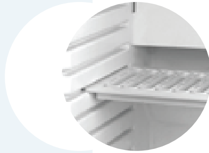
Ayarlanabilir Raflar Adjustable Shelves