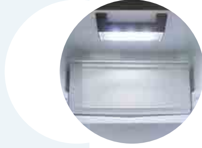
Led İç Aydınlatma Interior Led Lightning