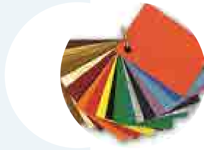
Renk Seçenekleri Optimal Colors